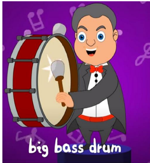
big bass drum